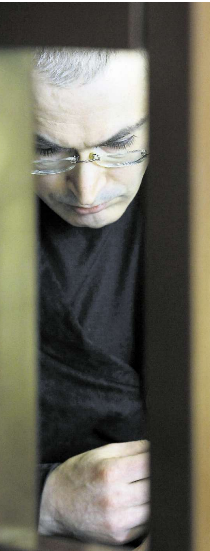
Michail Chodorkowski in einem Moskauer Gericht: Der Ex-Chef von Yukos sitzt wegen Steuerbetrugs in Haft und ist nun wegen Öldiebstahls angeklagt.